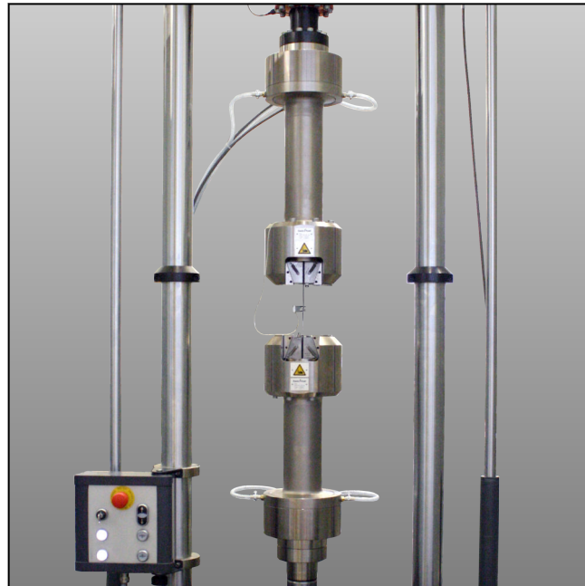
Keil-Probenhalter BOW-100 - Temperaturkammerversion