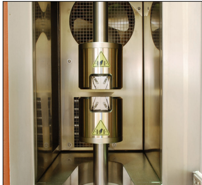
Keil-Probenhalter BOW-25 - Temperaturkammerversion

Das Spannzeug ist für 210 bar ausgelegt. Über die Probenhaltersteuerung kann es sowohl an 210 bar als auch an 280 bar-Systeme angeschlossen werden.